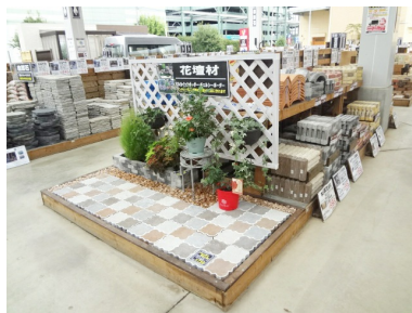
②お庭づくり応援コーナー