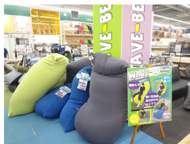
③ビーズクッション売場