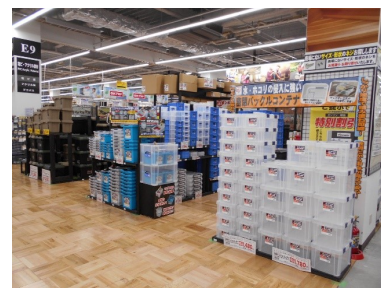
③ストレージコーナー

写真①：木材売場。長尺の木材をより買いやすくするため、店頭付近に売場を移動。十分な在庫量で大量購入にも対応。