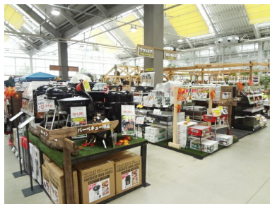
①アウトドアガーデンコーナー

インドアグリーンコーナーでは、置くだけでお部屋の印象を変え、癒しを与えてくれるインテリア観葉売場を充実させて「植物のある暮らし」を提案し、園芸雑貨も新規商品を導入し種類豊富に展開いたします。