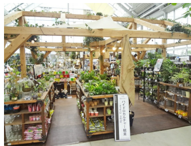
③インドアグリーンコーナー

写真①：アウトドアガーデンコーナー。テント、タープなどのキャンプ用品及びバーベキュー用品を展開。