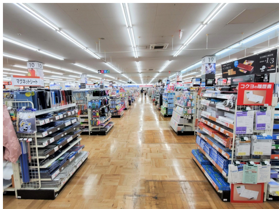
広々とした通路を確保

また、2階の生活館にはインテリア用品、カーテン売場を移設。日用品、家庭用品、事務店舗用品、インテリア・カーテン、インテリア用品、カーテン、家電等一般向けの商品群を展開します。