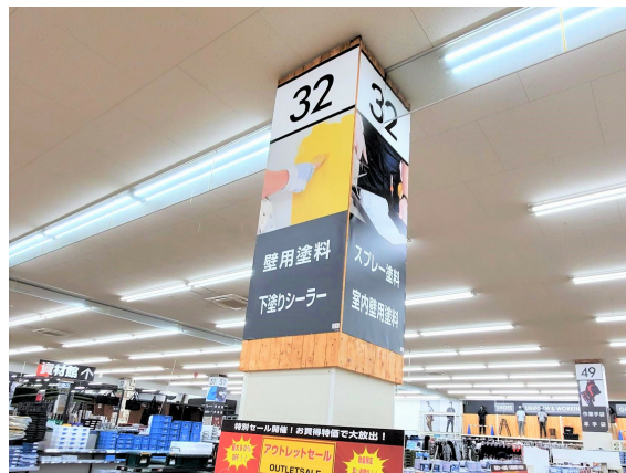
商品を探しやすいようにサインを売り場ごとに設置