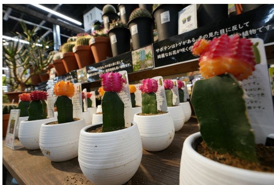
ガーデンコーナーイメージ②