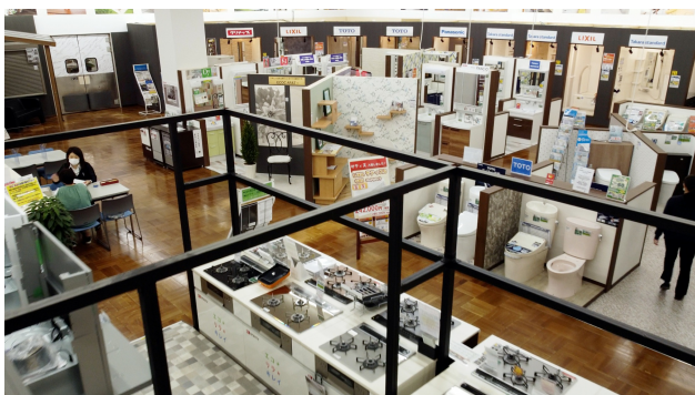
ショールームイメージ

リフォームコーナーの「アークホーム」では、経験豊かで専門知識が豊富なスタッフや建築分野の有資格者を配置し、気軽に立ち寄れて安心して相談できるリフォームショールームをご用意しています。