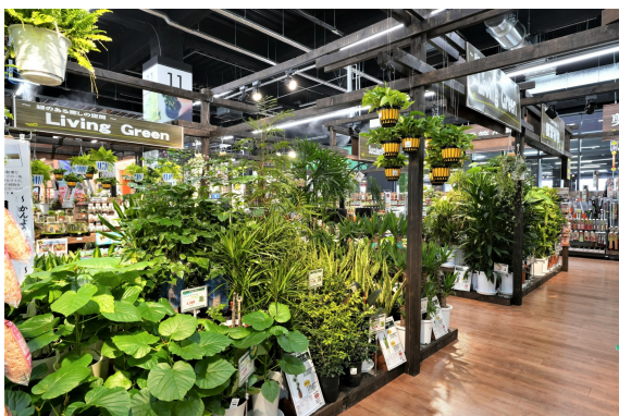
ガーデンコーナーイメージ①